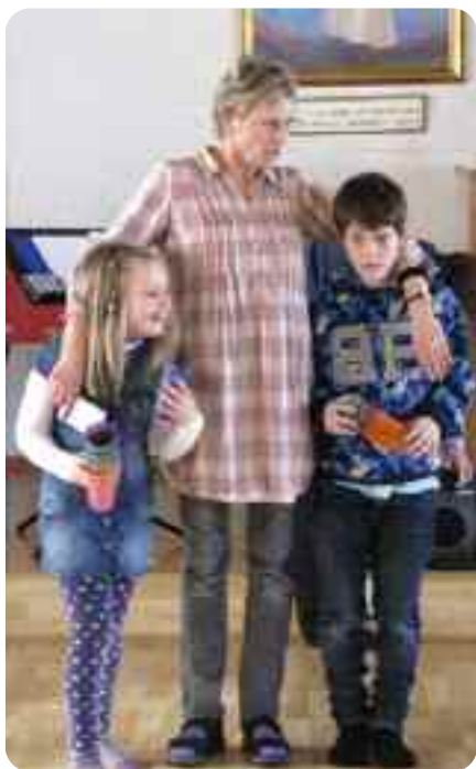
Gro seier at forrige laurdagsklubb var det søle-rekord under saft- og kjeks-pausen! Ho håper det går betre i dag!