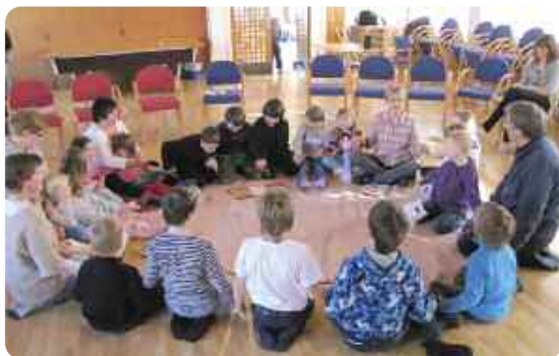
“Vi tek kvarandres hender og set oss i ein ring. Vi er ei mengd med søsken, det skil oss ingenting. For Gud er Far til alle og jorda er vår stad. Og alle verdas menneske vil vi til vener ha.”