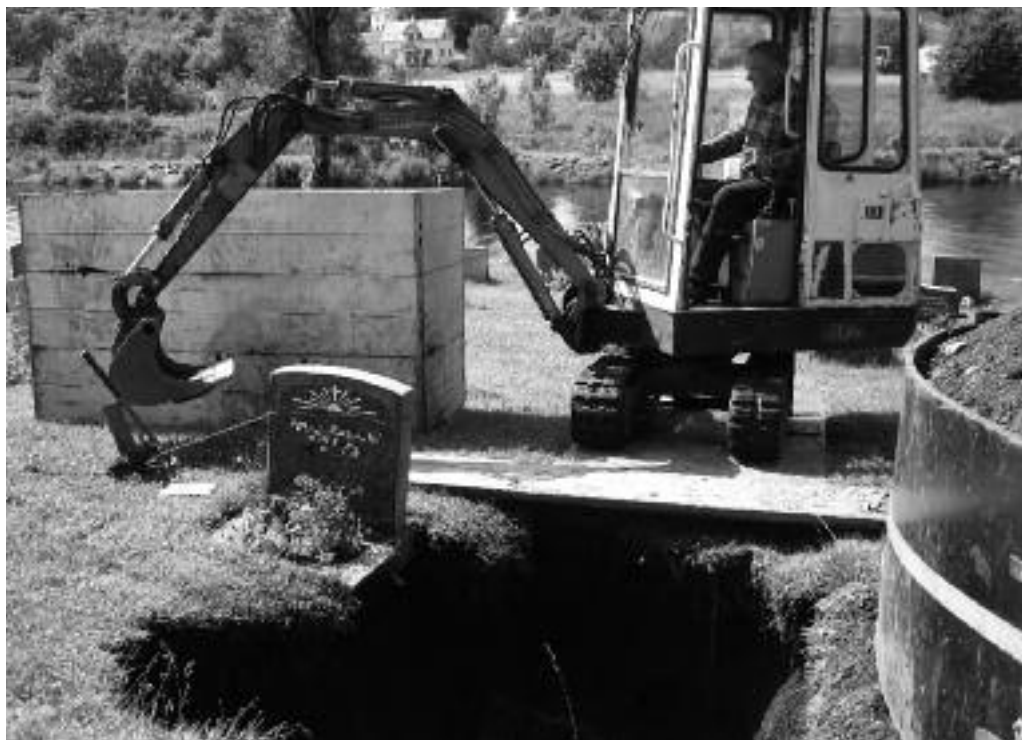
Utfordrande gravearbeid for vår dyktige gravar.