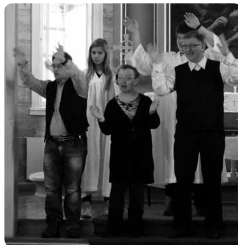
Medliturgane viser rørslane i bønnesalmen "Ver meg nær, O Gud."